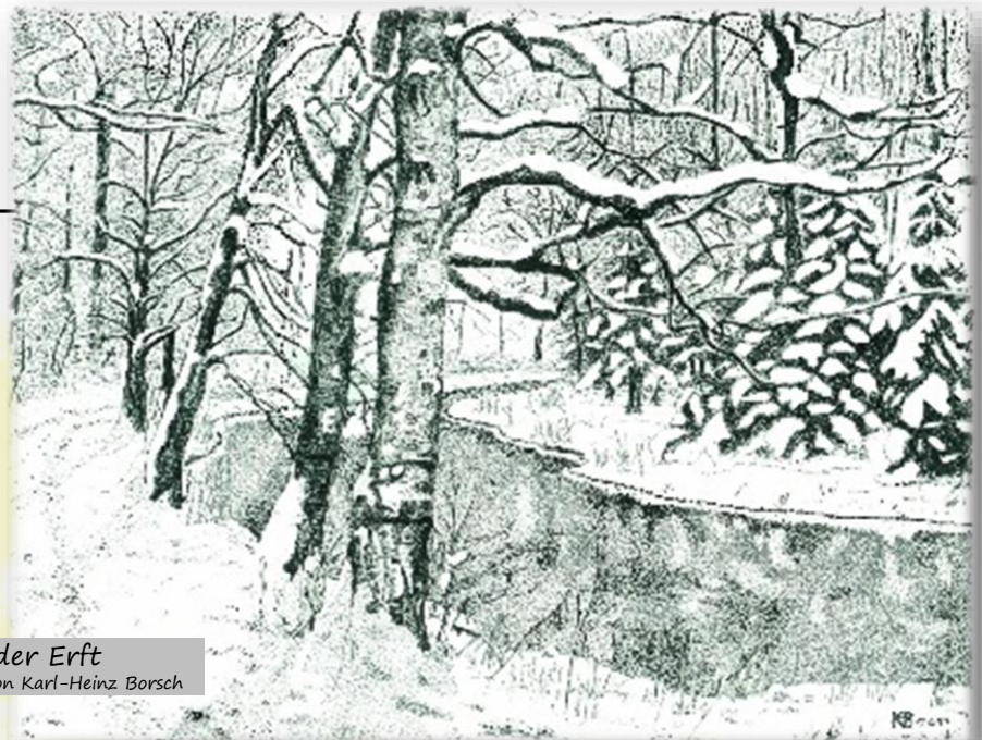
Winter an der Erft - von Karl-Heinz Borsch